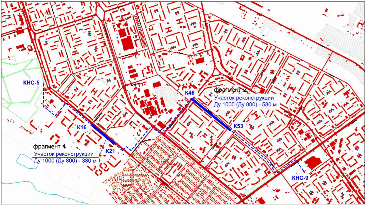
Схема расположения участков реконструкции канализационного коллектора № 9 Ду 1000 мм от КНС 5 до КНС 9