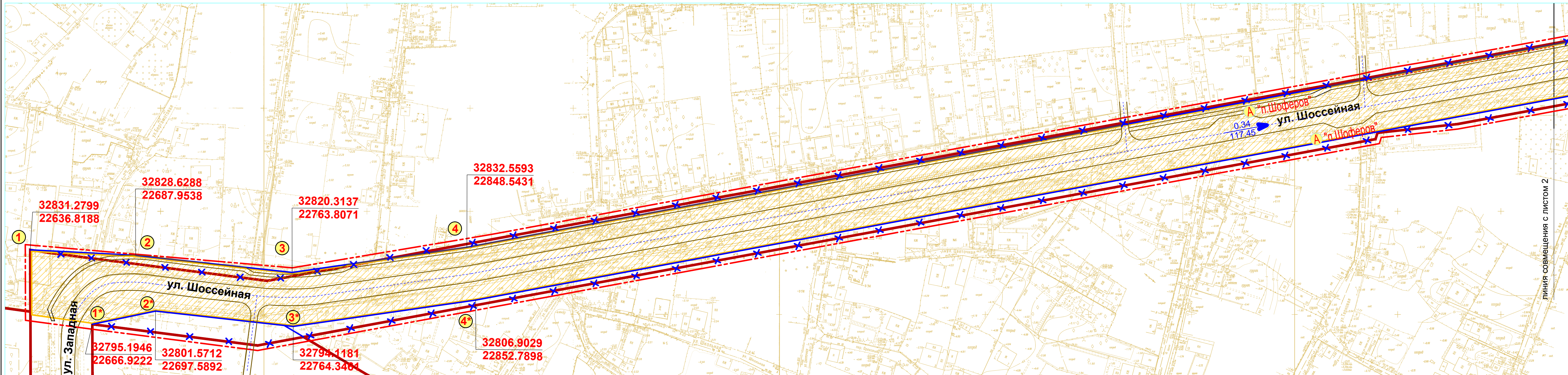
СХЕМА РАСКЛАДКИ ЛИСТОВ: