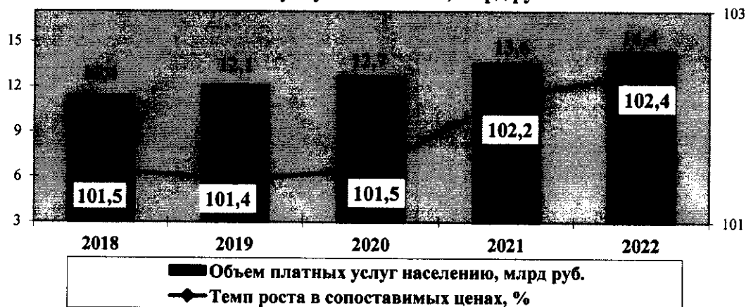
Объем платных услуг населению, млрд рублей

По оценке 2019 года, среднегодовой индекс потребительских цен составит 104,7 %, в прогнозном периоде 2020–2022 годов – в пределах 103,3–104,0 %.