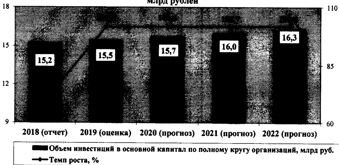
Объем инвестиций в основной капитал по полному кругу организаций, млрд рублей

Ожидается, что в 2019 году объем инвестиций в основной капитал по крупным и средним организациям составит порядка 12,9 млрд рублей (увеличение к уровню 2018 года – 1,5 %). Сохранится умеренная положительная динамика: объем инвестиций в основной капитал по крупным и средним организациям в 2020 году – 13,1 млрд рублей (рост к уровню 2019 года – 1,6 %), в 2021 году – 13,3 млрд рублей (рост к уровню 2020 года – 1,7 %), в 2022 году – 13,6 млрд рублей (рост к уровню 2021 года – 1,8 %).