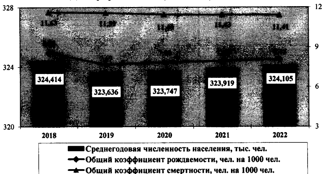
Демографическая ситуация в городе Волжском

В 2019 году, по сравнению с 2018 годом, наблюдается снижение среднегодовой численности населения.