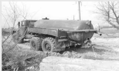
Облкомприроды запускает пилотный проект и предлагает жителям области

СНЯТЬ НА ВИДЕО ИЛИ ФОТО факт размещения мусора гражданами и организациями, а также сброса жидких отходов ассенизаторскими машинами на почву.