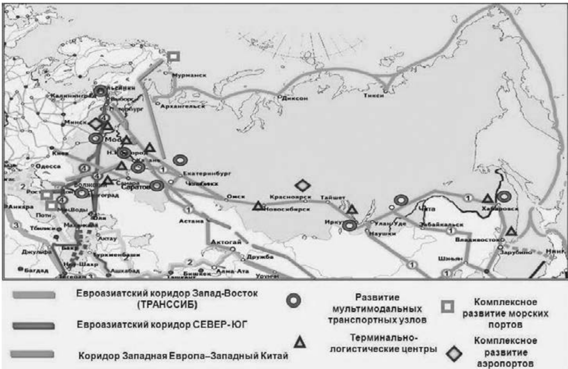
Приложение № 2 к Инвестиционной стратегии