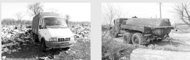
Облкомприроды запускает пилотный проект и предлагает жителям области

СНЯТЬ НА ВИДЕО ИЛИ ФОТО факт размещения мусора гражданами и организациями, а также сброса жидких отходов ассенизаторскими машинами на почву.