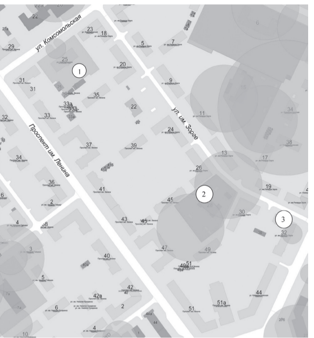
Схема границ прилегающих к организациям и объектам территорий, на которых не допускается розничная продажа алкогольной продукции, расположенных в 14-м квартале городского округа – город Волжский Волгоградской области

1. ГБУЗ «Волгоградский областной онкологический диспансер № 3», Волгоградская область, г. Волжский, ул. Комсомольская, 25.