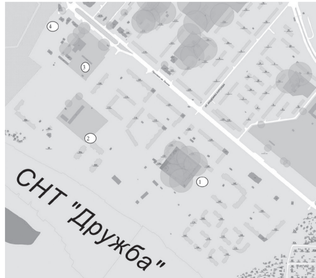
Схема границ прилегающих к организациям и объектам территорий, на которых не допускается розничная продажа алкогольной продукции, расположенных в 14- м микрорайоне городского округа – город Волжский Волгоградской области