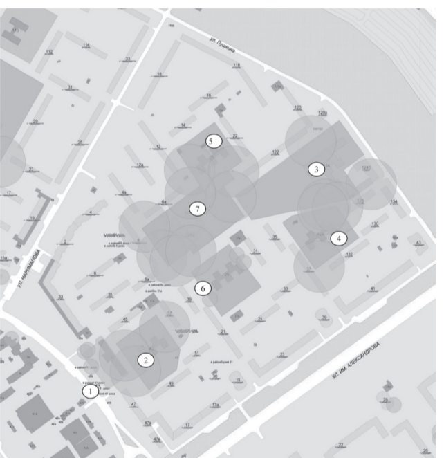
Схема границ прилегающих к организациям и объектам территорий, на которых не допускается розничная продажа алкогольной продукции, расположенных в 17-м микрорайоне городского округа – город Волжский Волгоградской области

1. ГБУЗ «Городская поликлиника № 4», Волгоградская область, г. Волжский, ул. Мира, 41.