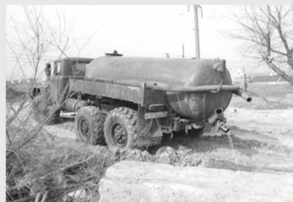
Облкомприроды запускает пилотный проект и предлагает жителям области

СНЯТЬ НА ВИДЕО ИЛИ ФОТО факт размещения мусора гражданами и организациями, а также сброса жидких отходов ассенизаторскими машинами на почву.