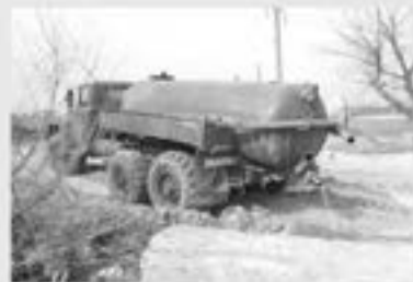
Облкомприроды запускает пилотный проект и предлагает жителям области

СНЯТЬ НА ВИДЕО ИЛИ ФОТО факт размещения мусора гражданами и организациями, а также сброса жидких отходов ассенизаторскими машинами на почву.