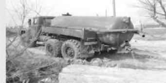
Облкомприроды запускает пилотный проект и предлагает жителям области

СНЯТЬ НА ВИДЕО ИЛИ ФОТО факт размещения мусора гражданами и организациями, а также сброса жидких отходов ассенизаторскими машинами на почву.