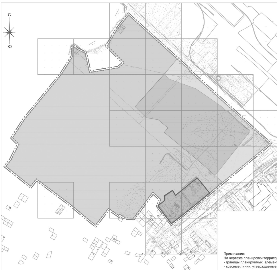
Чертеж планировки территории

Приложение № 2 к постановлению администрации городского округа - город Волжский Волгоградской области от 22.04.2020 № 2124