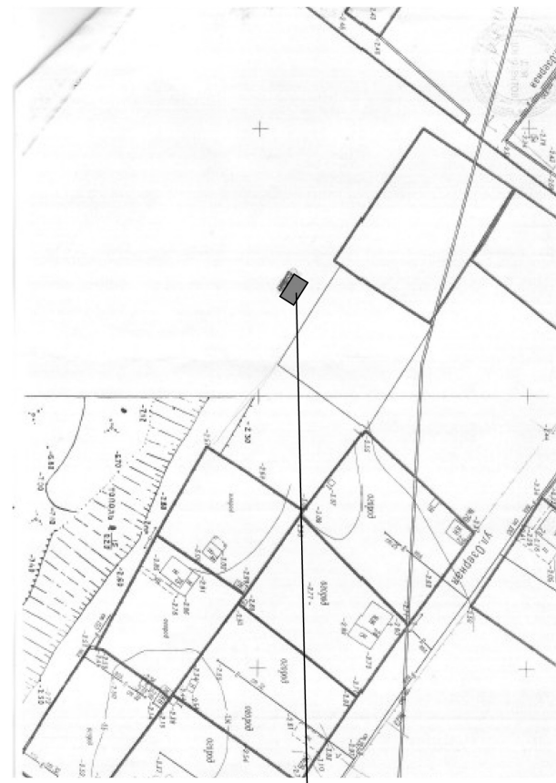
Место размещения НТО

Ситуационный план в масштабе М 1:500 места размещения нестационарного торгового объекта – тонара площадью 8,0 кв. м для реализации продовольственных товаров, расположенного по адресу: СНТ «Дружба», ул. Озерная, д. 72 (напротив земельного участка), г. Волжский