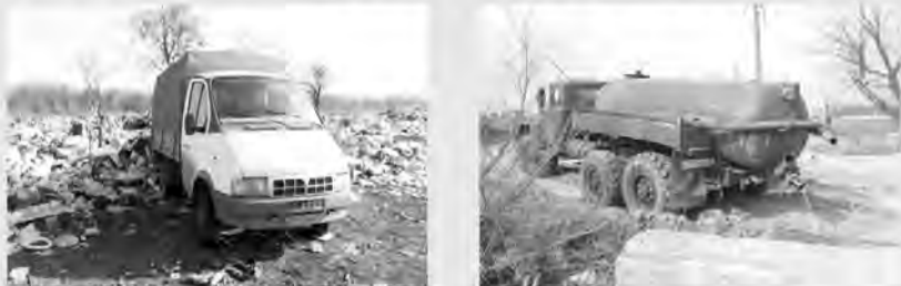
Облкомприроды запускает пилотный проект и предлагает жителям области

СНЯТЬ НА ВИДЕО ИЛИ ФОТО факт размещения мусора гражданами и организациями, а также сброса жидких отходов ассенизаторскими машинами на почву.