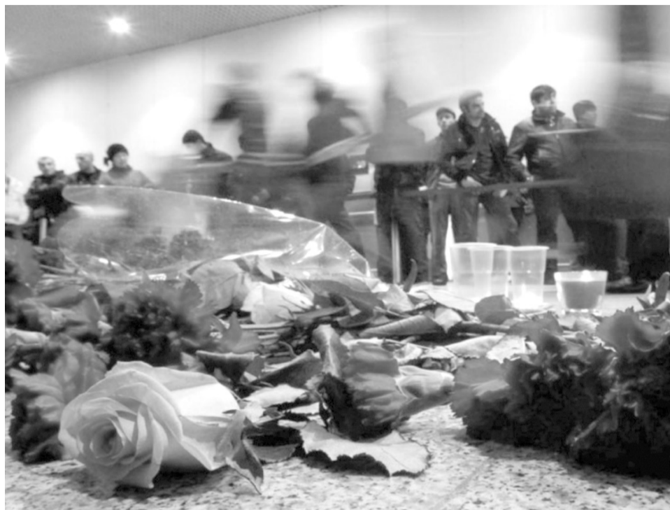
Уважаемые Волжане! При получении информации об угрозе террористического акта обезопасьте свое жилище

Управление по делам ГО и ЧС администрации городского округа – г. Волжский